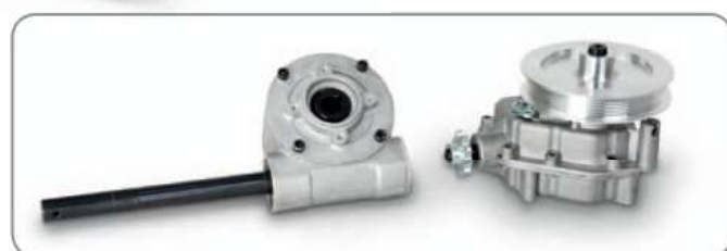
Hochwertigste Getriebe für störungsfreien Lauf