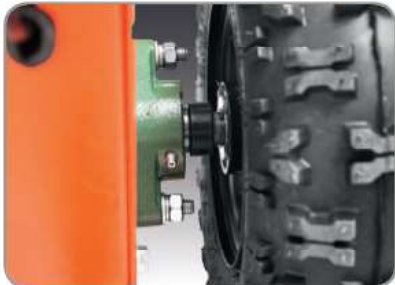
Gusseisener Lagerflansch Serienmäßig.