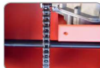
Robuster K 360°-Freilauf!