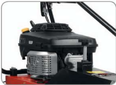
Kraftvoller Kawasaki -Motor.